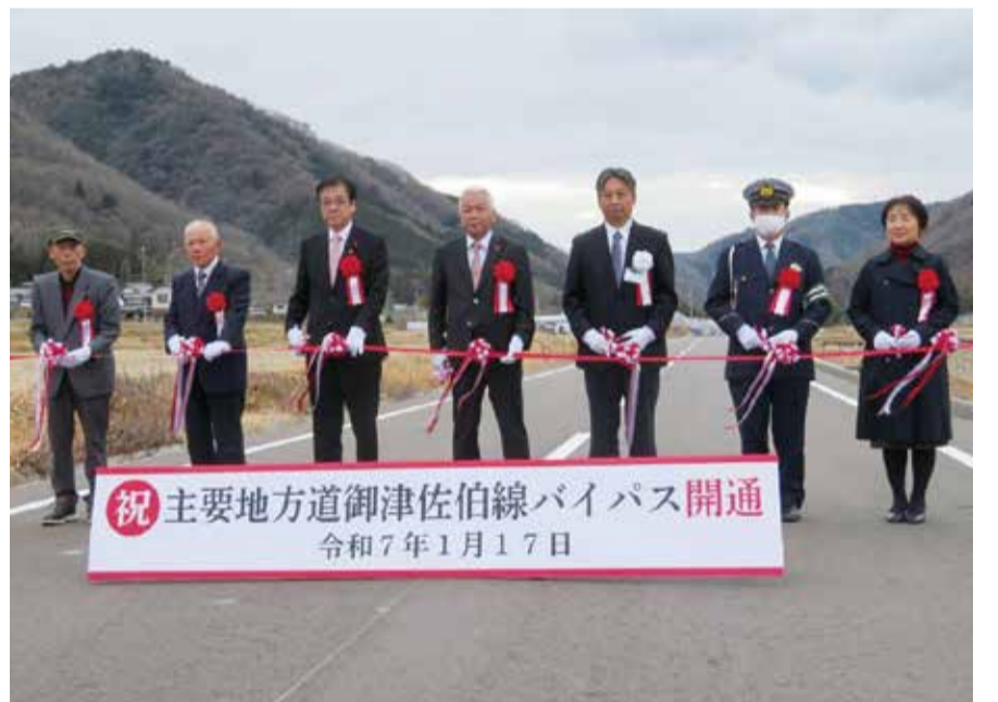
2025.1.17 主要地方道 御津佐伯線バイパス開通式

また、早期の整備促進に向け、岡山市や津山市など沿線自治体で構成する空港津山道路整備促進協議会として、毎年夏と秋に国、県及び県選出国会議員へ要望活動を行うとともに、岡山市においても毎年度、政策提言、要望事項の中に掲げている。