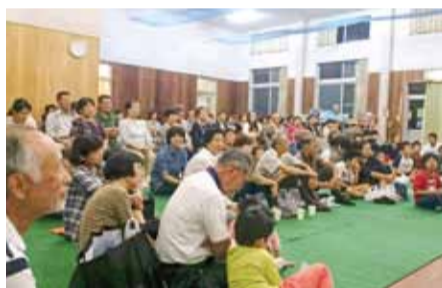
御津宇垣原のお月見交流会