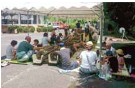
建部町和田南の三世交代交流会

少子化・人口減少への対応策を取る事が必要な周辺地域ですが、二世世代交流や、小地域での活動等への取組を次世代から引き続いて行っている地域や、新しく始める地域も出てきています。活力のある元気な地域と地域の結びつきを深めていく重要な事だと思えます。今後とも頑張って頂きたいと思えます。