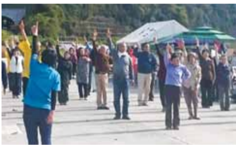
建部町ふるさと野菜市感謝祭

岡山市は、健康長寿の延伸を目指して様々な取組を行っています。が、それぞれの地域で「グラウンドゴルフ」や「OKAYAMA! 市民体操」の啓発活動等で地域交流・健康寿命の延伸に取り組んでいます。