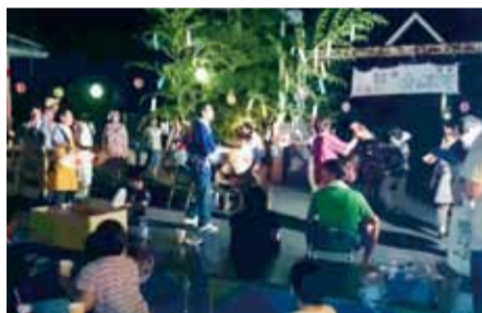
御津富谷の夕涼み会