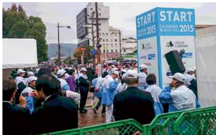
おかやまマラソンのスタート前

第1回おかやまマラソンが1万4千人以上のランナーの参加で11月8日に盛大に開催されました。4月の改選前まで所属していた委員会で、一年以上かけて、競技運営計画、広報・協賛募集計画等の多くの議論を重ねてきた事業です。マスコミでは大成功との評価を受けています。第2回の大会も多くのランナーの参加で大成功となるよう期待をしています。