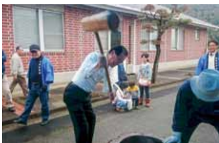
御津公民館まつり